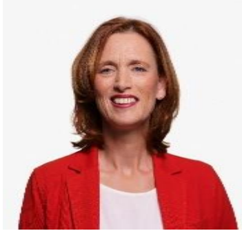
Karin Prien