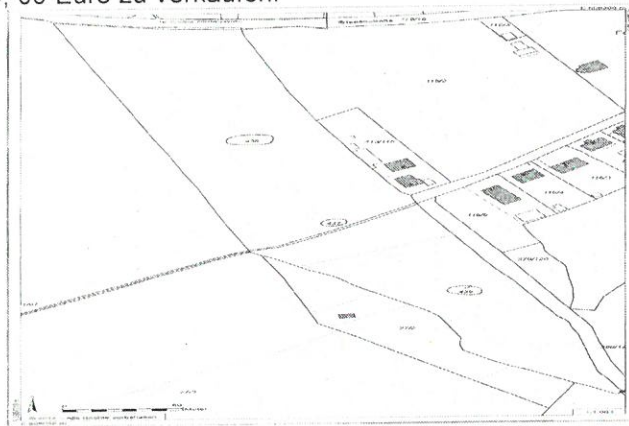
örtl. Lage der vorvez. Flurstücke in der Gem. Berkenthin –Gemarkung Klein Berkenthin, Flur 3 -

Die Interessentenschaft Göldenitz beabsichtigt, die nach erfolgter Umgemeindung nunmehr im Gemeindebezirk Berkenthin liegenden Flurstücke in der Größe von insgesamt 24.111 m 2 (24.015 m 2 zuzüglich der mit Kaufvertrag vom 02.03.2016 von der Gemeinde Göldenitz erworbenen jedoch im Grundbuch noch nicht zugeschriebenen ehemaligen Wegeparzelle von 96 m 2 ), an die Gemeinde Berkenthin zum Festpreis von 370.000, 00 Euro zu verkaufen.