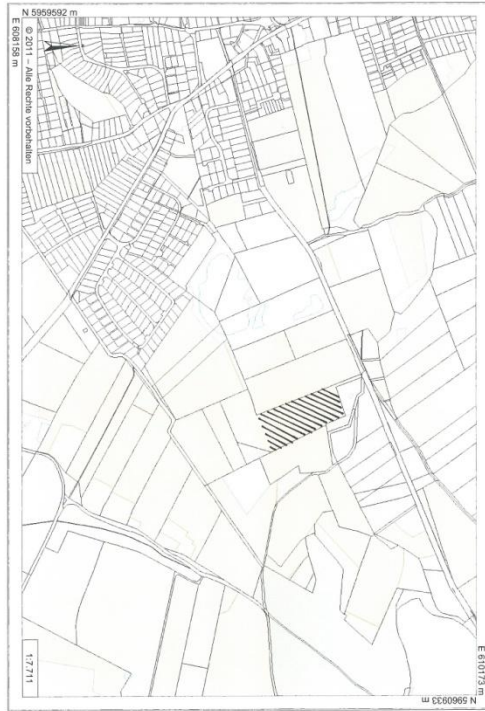
Krummesse, Beidendorfer Weg: